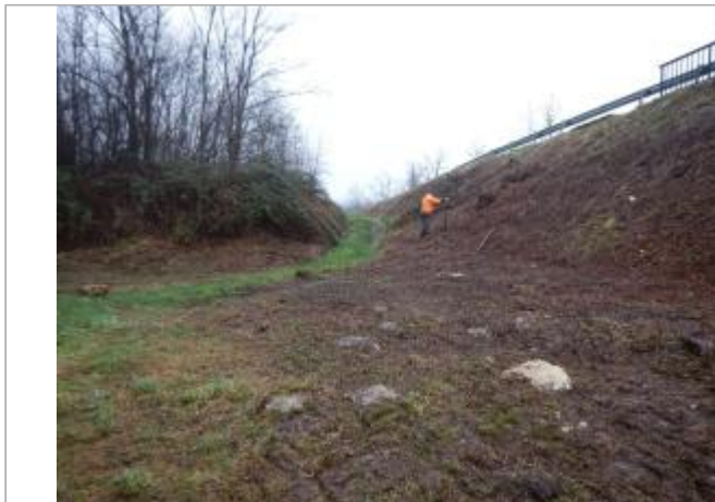
Site et repère de la crue de janvier 2018

Coordonnées WGS84 : X: 3.96786500 / Y: 46.48818600