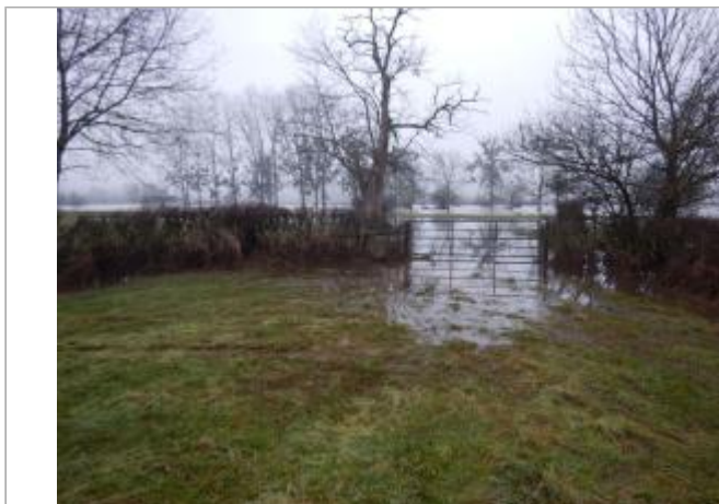
Site pendant la crue de janvier 2018