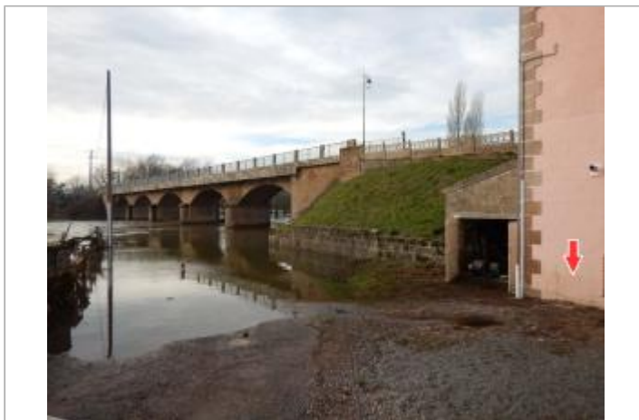
Site et repère de la crue de janvier 2018