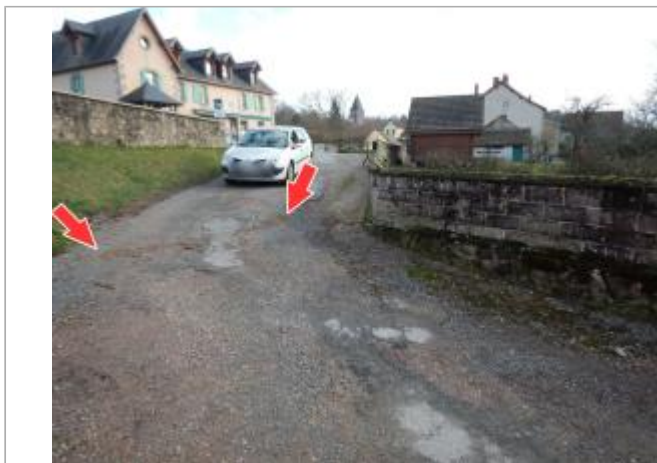
Site et repère de la crue de janvier 2018