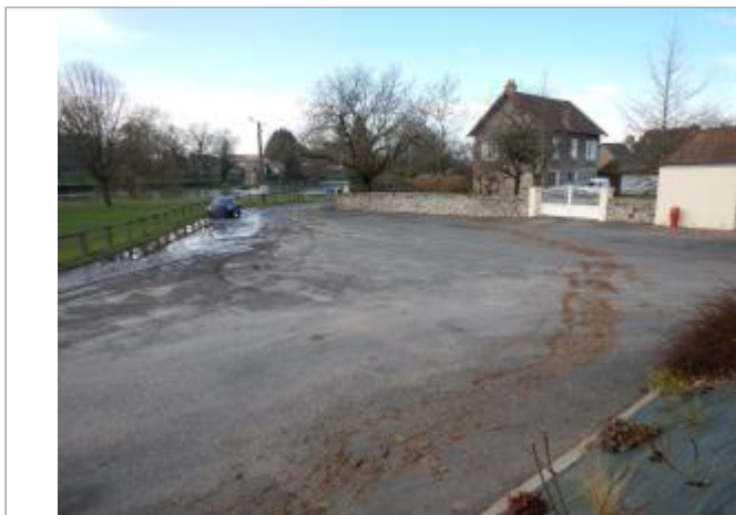
Site et repère de la crue de janvier 2018