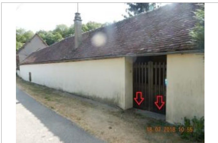
Laisses d'inondations sur le portail

MARQUE Maximum de l'inondation : Oui Visibilité : Oui Repère calculé : Non Pérennité : Aucune PHEC : Non