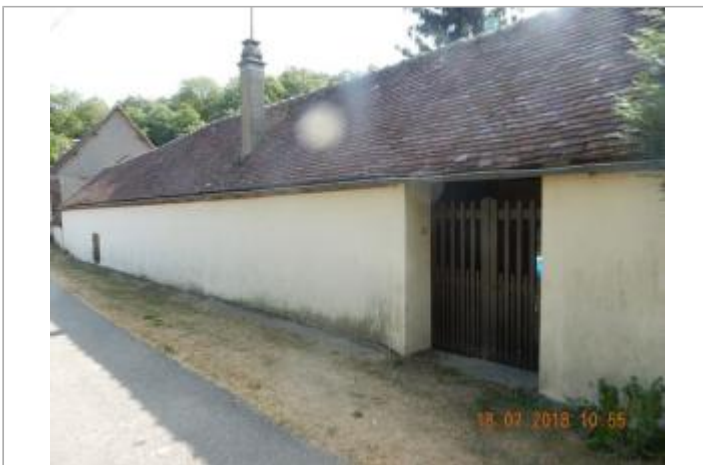
N°6 rue Saint-Lubin

GÉOLOCALISATION Coordonnées WGS84 : X: 1.09062009 / Y: 48.71003590 Coordonnées RGF93 (Lambert 93) X: 559521.29 / Y: 6847242.68 Coordonnées RGF93 (ETRS89) : X: 1.0906201 / Y: 48.7100359 Code Hydro: H4240600 Rive de référence: Droite