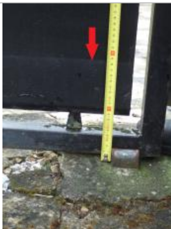
Vue de la laisse - Auteur : SPC SMYL