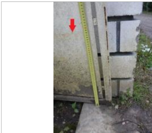
Vue de la laisse - Auteur : SPC SMYL