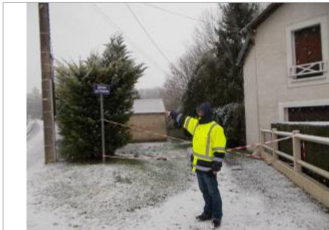
Vue du site - Auteur : SPC SMYL

Coordonnées WGS84 : X: 3.20561334 / Y: 48.96492380