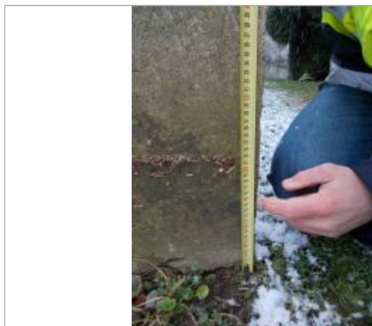
Vue de la laisse - Auteur : SPC SMYL

Altitude calculée de l'eau (en m) : 56.457 m