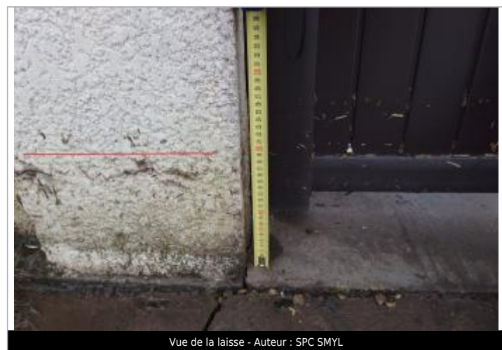
Vue de la laisse - Auteur : SPC SMYL