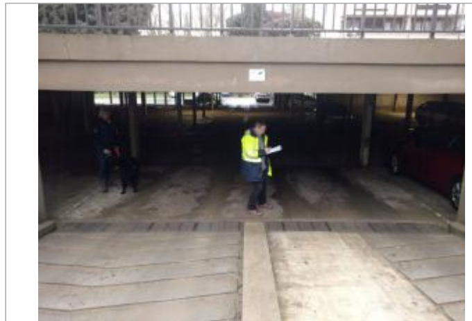
Vue du site - Auteur : SPC SMYL

Coordonnées WGS84 : X: 2.51588165 / Y: 48.78491910