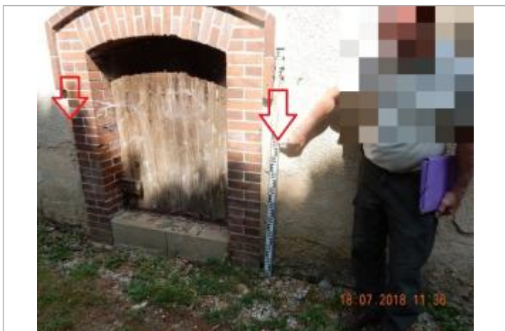
A l'extérieur du lavoir

Type de repérage : Campagne de terrain post-inondation Organisme(s) : SPC Seine aval - Côtiers normands