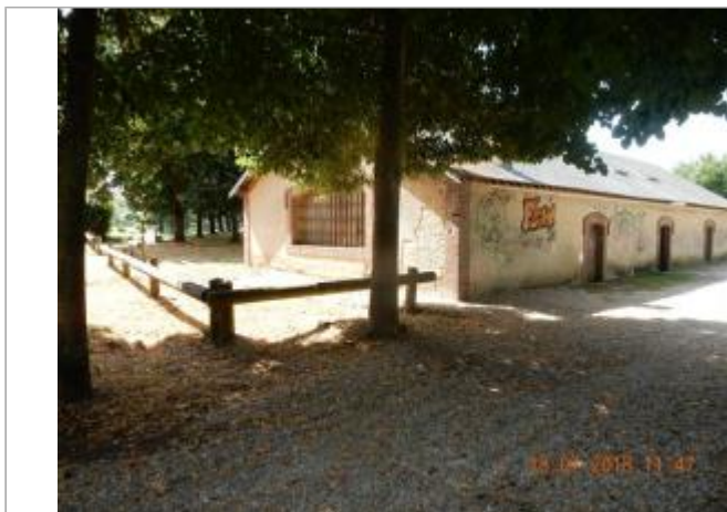
Le lavoir de Brezolles