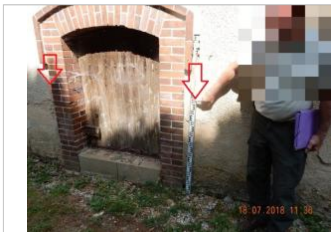
A l'extérieur du lavoir

Organisme : SPC Seine aval - Côtiers normands