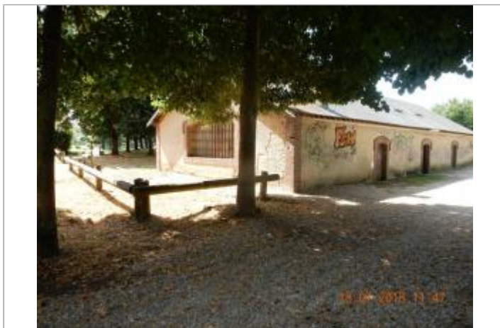
Le lavoir de Brezolles