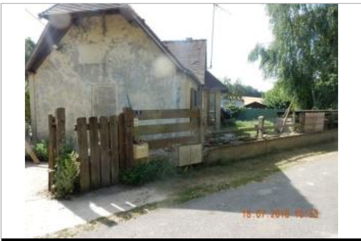
N°5 rue Saint-Lubin

GÉOLOCALISATION Coordonnées WGS84 : X: 1.09049533 / Y: 48.70987210 Coordonnées RGF93 (Lambert 93) X: 559511.67 / Y: 6847224.69 Coordonnées RGF93 (ETRS89) : X: 1.0904953 / Y: 48.7098721 Code Hydro: H4240600 Rive de référence: Droite