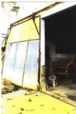
Mur de hangar

Altitude calculée de l'eau (en m) : 97.93 m