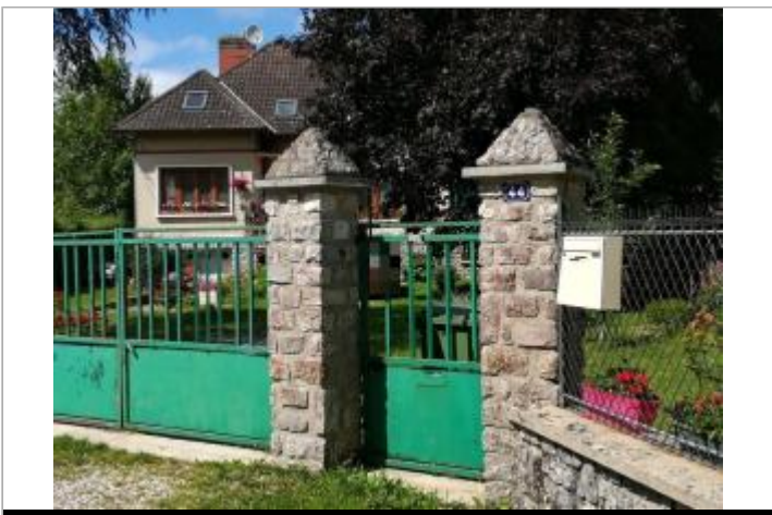
N° 44 rue de Waddington

GÉOLOCALISATION Coordonnées WGS84 : X: 1.27196910 / Y: 48.76136000 Coordonnées RGF93 (Lambert 93) X: 572986.3 / Y: 6852640.38 Coordonnées RGF93 (ETRS89) : X: 1.2719691 / Y: 48.76136 Code Hydro: H42-0400 Rive de référence: Droite