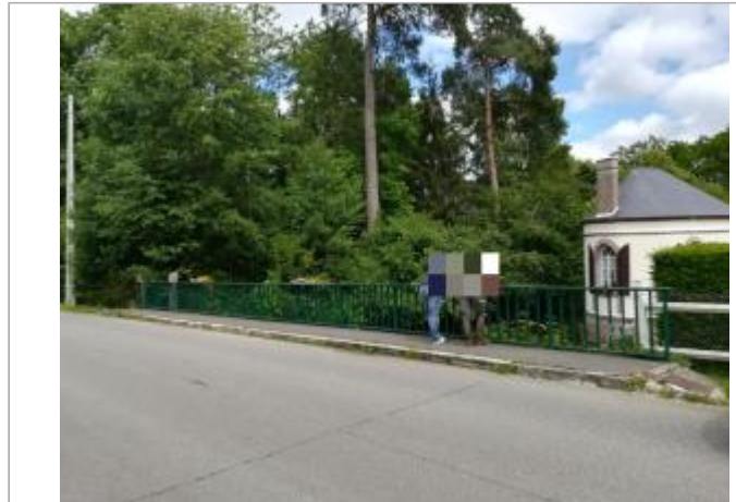
Ilot dans le lit de l'Avre