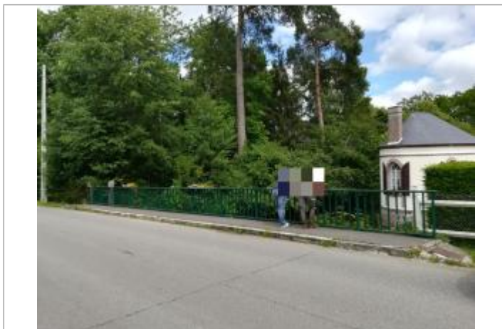
Ilot dans le lit de l'Avre