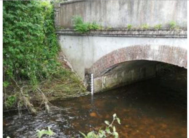
Echelle du SIVA en amont du pont de la RD 313-15