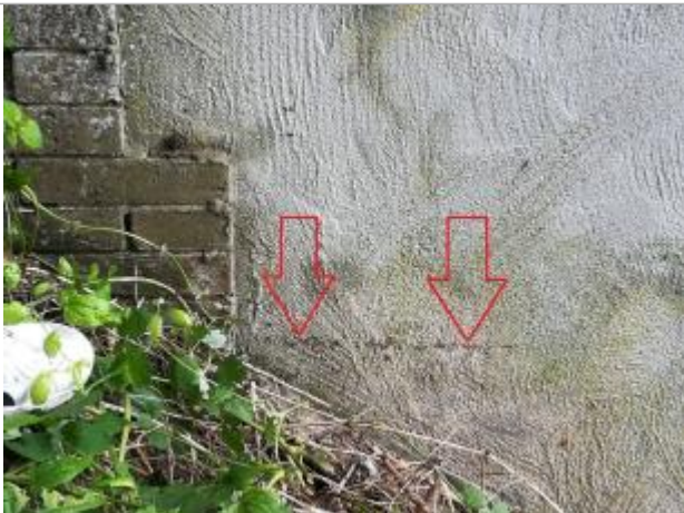
Traces laissées sur l'ouvrage

Organisme : SPC Seine aval - Côtiers normands