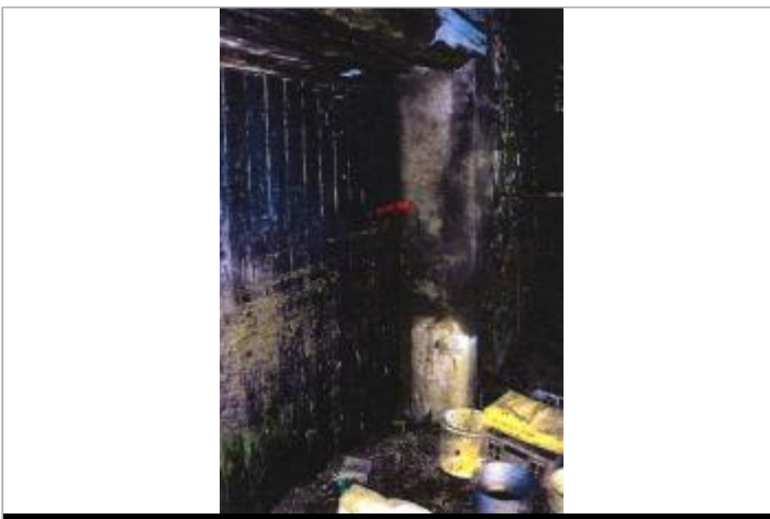
Porte de hangar

GÉOLOCALISATION Coordonnées WGS84 : X: 2.43266390 / Y: 43.23222300 Coordonnées RGF93 (Lambert 93) X: 653883.44 / Y: 6237168.2 Coordonnées RGF93 (ETRS89) : X: 2.4326639 / Y: 43.232223 Code Hydro: Y1410500 Rive de référence: