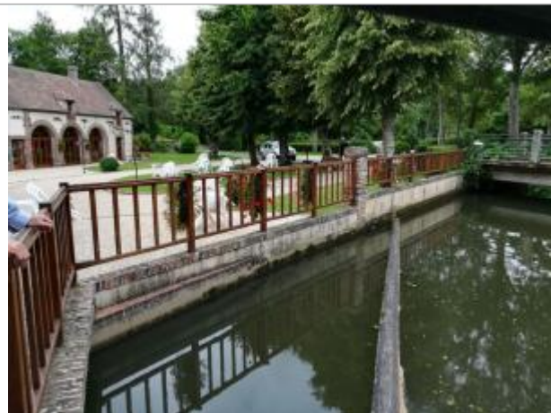
Bras usinier de l'Avre à l'amont du vannage