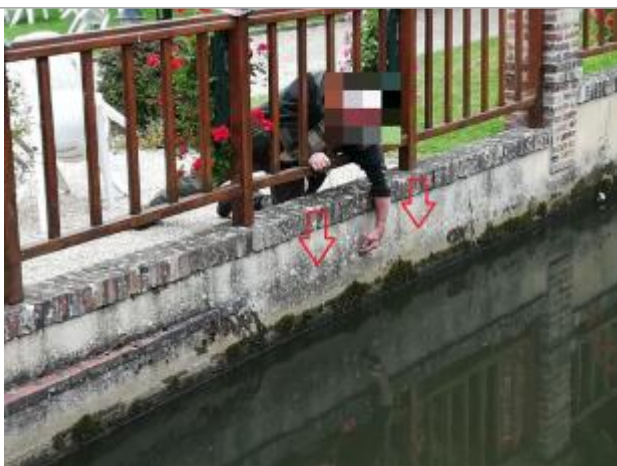
Traces laissées par l'inondation

Organisme : SPC Seine aval - Côtiers normands