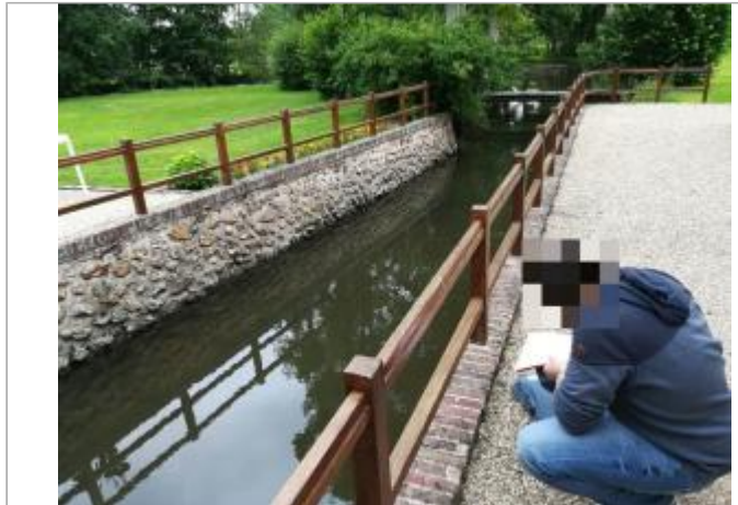
Bras usinier de l'Avre à l'aval du vannage