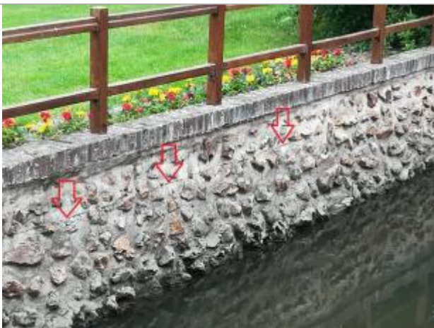
Traces laissées par l'inondation

Organisme : SPC Seine aval - Côtiers normands