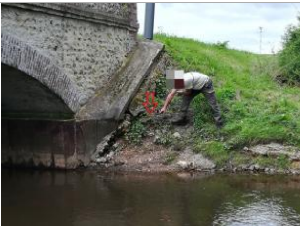
Dépôt de brindilles laissé par la crue

Organisme : SPC Seine aval - Côtiers normands