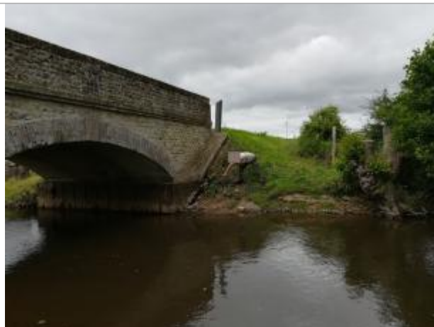
A l'aval du pont de la RD571