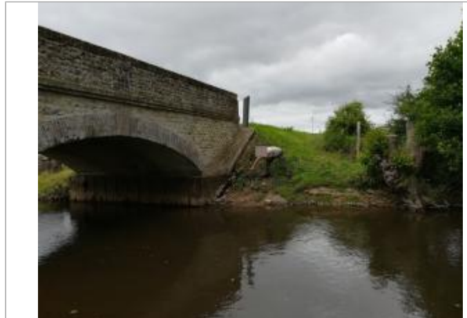
A l'aval du pont de la RD571