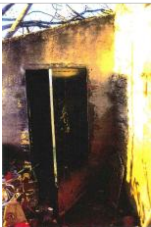
Mur du cabanon

Altitude calculée de l'eau (en m) : 92.25 m