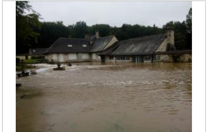
Moulin de Corblin Bonnelles 78