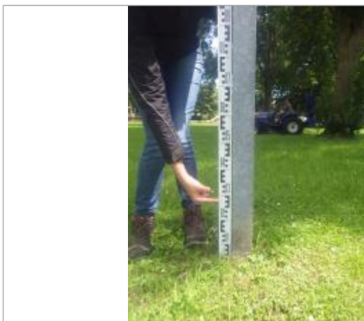
Marque montrant un niveau à 28 cm du sol

Altitude calculée de l'eau (en m) : 43.55