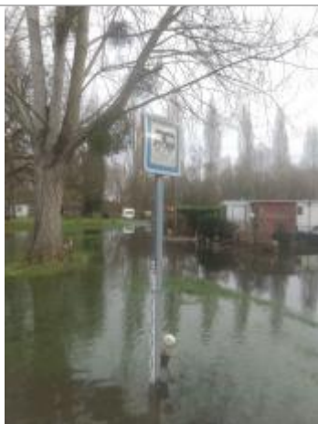
Vue éloignée_poteau vidange camping-car

NIVELLEMENT SPC SACN. LE SPC N'EST PAS GÉOMÈTRE EXPERT, LES COTES SONT DONNÉES À TITRE INDICATIF. - 23/08/2018