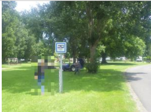
Vue sur le panneau