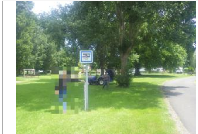
Vue sur le panneau

Coordonnées WGS84 : X: 0.70135026 / Y: 49.24091900