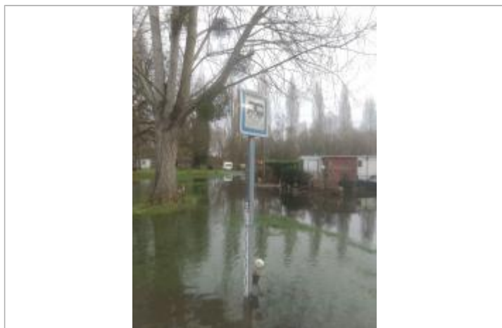
Vue éloignée_poteau vidange camping-car

NIVELLEMENT SPC SACN. LE SPC N'EST PAS GÉOMÈTRE EXPERT, LES COTES SONT DONNÉES À TITRE INDICATIF. - 23/08/2018