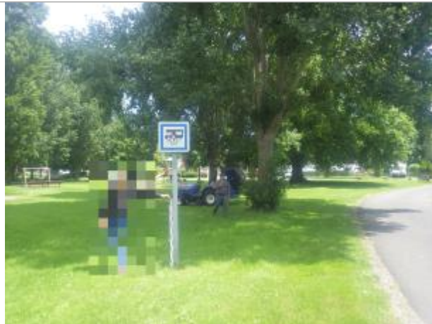
Vue sur le panneau