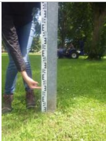
Marque montrant un niveau à 28 cm du sol

Altitude calculée de l'eau (en m) : 43.55