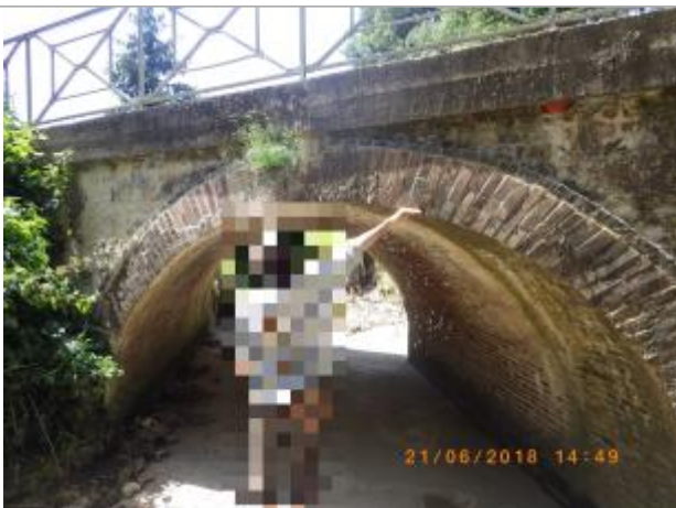
Pont quasiment en charge. Niveau matérialisé par la main (source : SPC SACN)

Altitude calculée de l'eau (en m) : 208.88 m