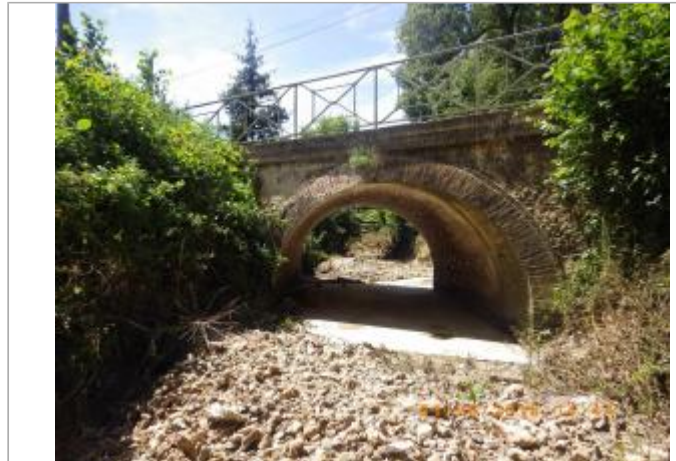
Vue sur le pont depuis l'aval