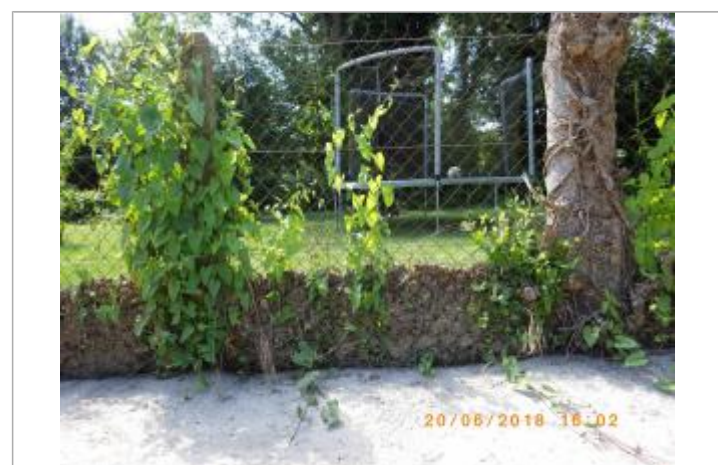
Vue depuis la rue sur les feuillages laissés par la crue sur le grillage