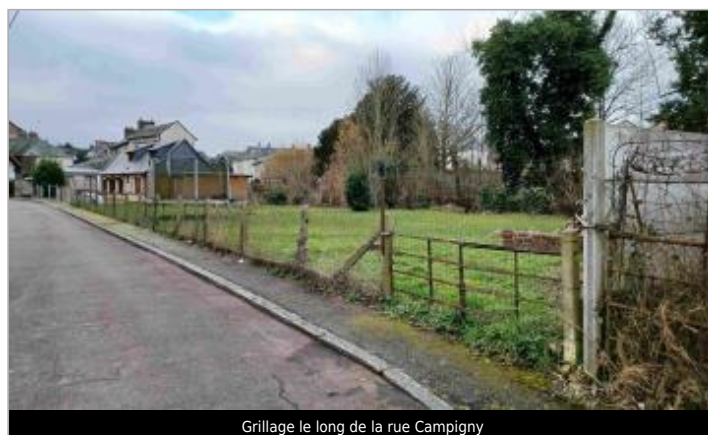
Grillage le long de la rue Campigny