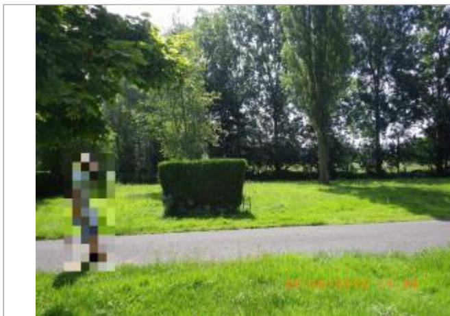
Vue sur la haie servant de support au repère