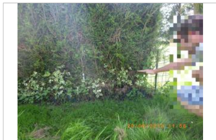
Laisse d'inondation visible sur le grillage, niveau matérialisé par la main