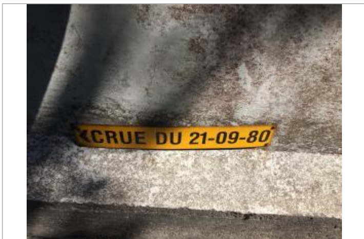
Vue du repère depuis le couronnement (2018)

Texte : CRUE DU 21-09-1980 Maximum de l'inondation : Oui Visibilité : Oui État du repère : Moyen Pérennité : Moyenne