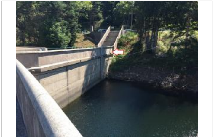
Vue du site depuis le couronnement (2018)