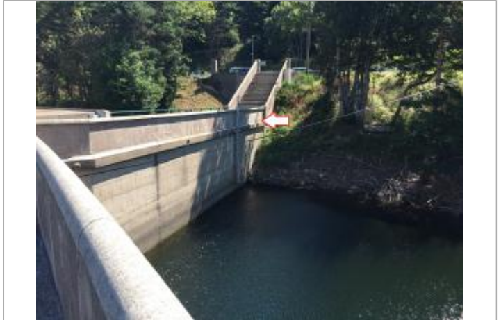
Vue du site depuis le couronnement (2018)