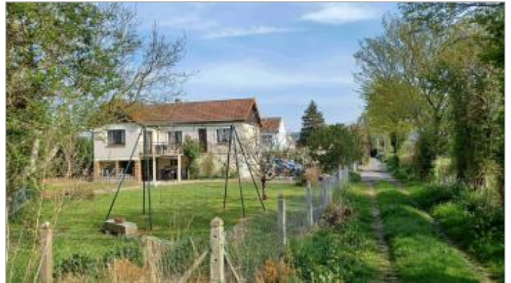
Marche de l'escalier extérieur de la maison au 3 Moulin de la Mouche