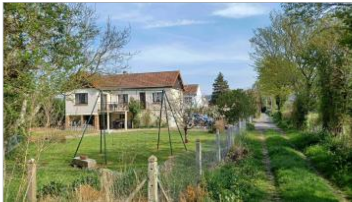
Marche de l'escalier extérieur de la maison au 3 Moulin de la Mouche