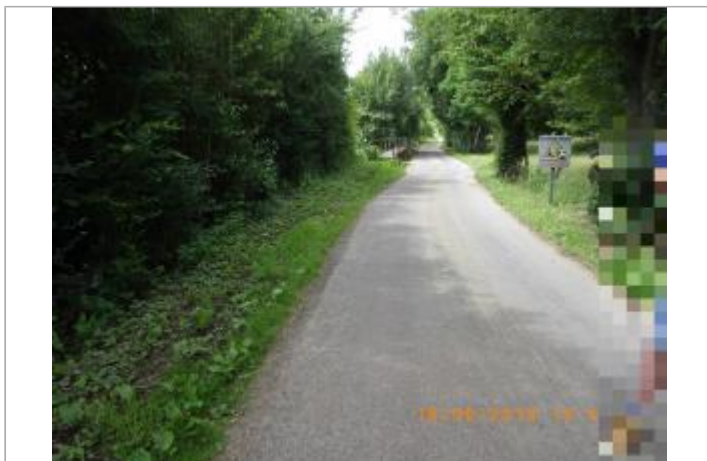
Route des Prés de la Sabotière avec le panneau "Ralentissez" (sour : SPC SACN)