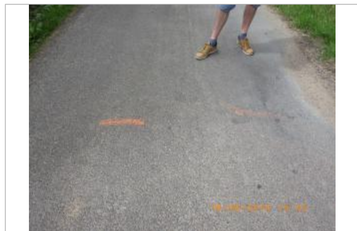
Marque peinte sur le sol, 10 à 15 m devant le poteau "Ralentissez"