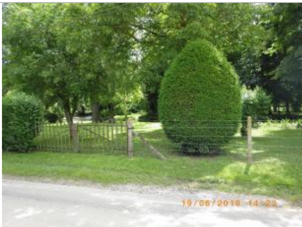
Vue de la clôture, à côté de l'ancien portail en bois

Altitude calculée de l'eau (en m) : 164.7 m