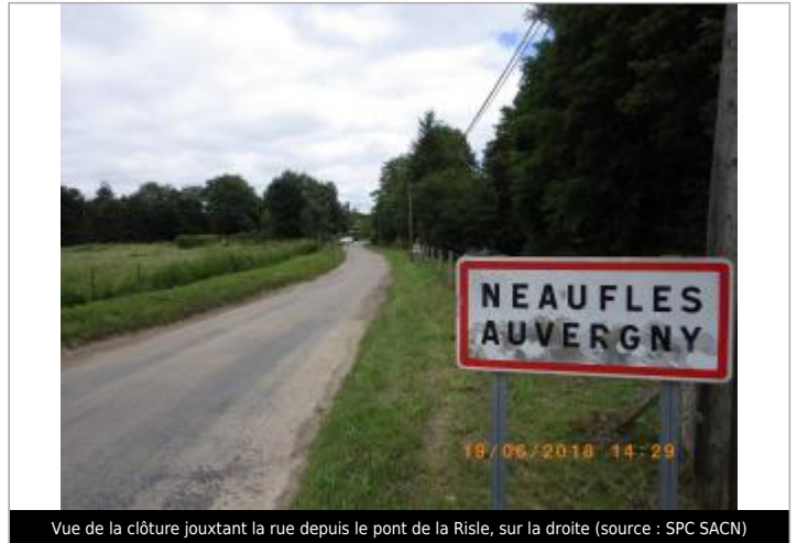
Vue de la clôture jouxtant la rue depuis le pont de la Risle, sur la droite