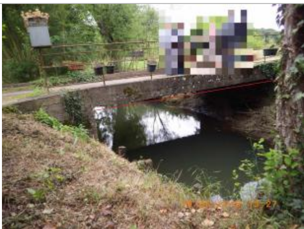
Niveau d'eau a presque atteint le tablier du pont

Altitude calculée de l'eau (en m) : 167.65 m