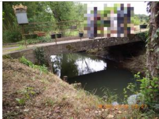
Vue sur le pont d'accès