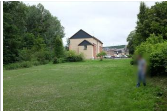
Laiasses limoneuses sur le terrain