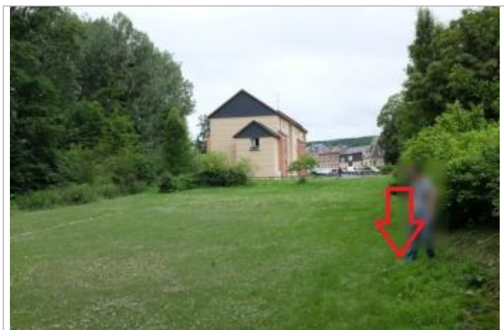
limite des dépôts limoneux au sol

Type de repérage : Campagne de terrain post-inondation Organisme(s) : SPC Seine aval - Côtiers normands