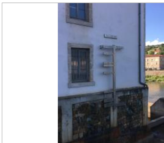
Vue de l'échelle (juillet 2018)

Maximum de l'inondation : Oui Visibilité : Oui État du repère : Bon Pérennité : Longue