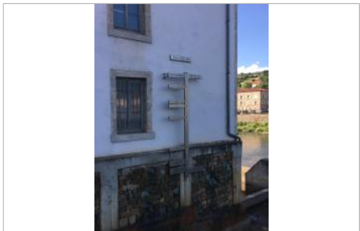
Vue de l'échelle (juillet 2018)

Maximum de l'inondation : Oui Visibilité : Oui État du repère : Bon Pérennité : Longue