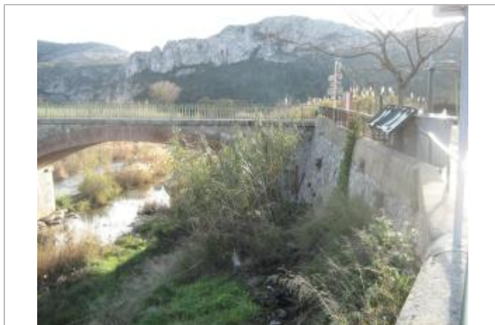
Vue du site - Auteur : CACG