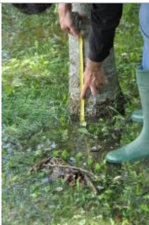
Vue de la marque - SPC SMYL