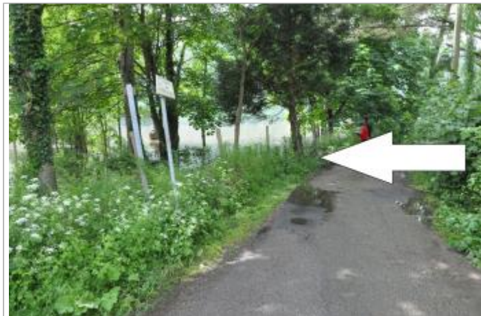
Vue du site - SPC SMYL