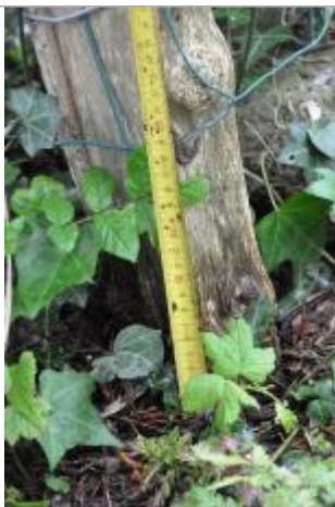
Vue de la marque - SPC SMYL

Altitude calculée de l'eau (en m) : 15.6 m