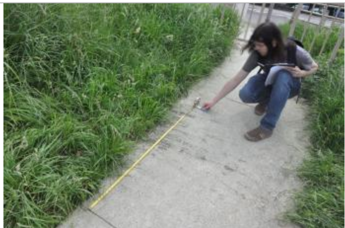
Vue de la marque - SPC SMYL

Altitude calculée de l'eau (en m) : 24.12 m