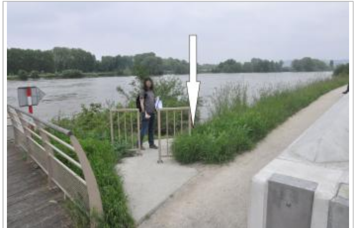
Vue du site - SPC SMYL