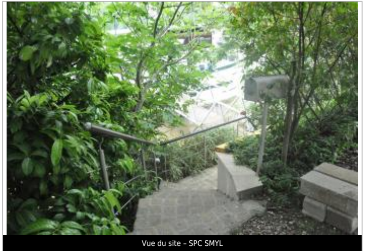
Vue du site - SPC SMYL

Coordonnées WGS84 : X: 2.17235480 / Y: 48.98065400