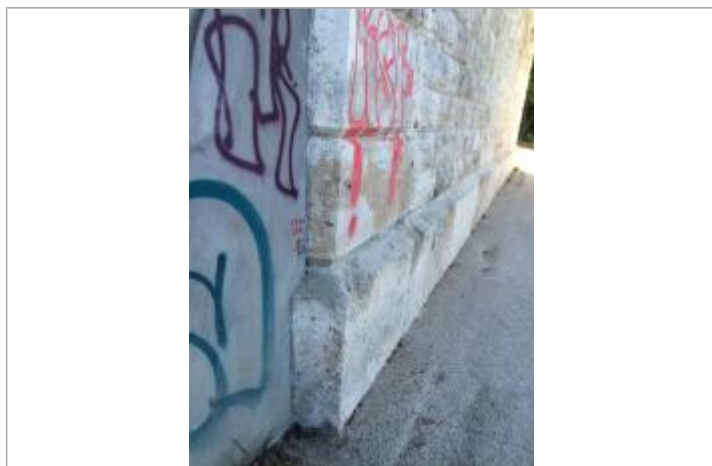
Vue de la marque - SPC SMYL

Altitude calculée de l'eau (en m) : 26.22 m