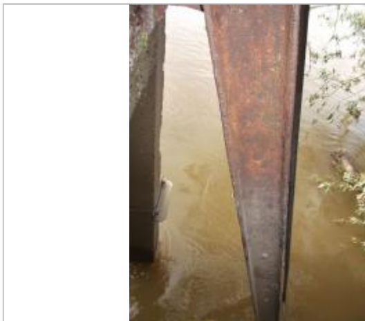
Vue de la marque - SPC SMYL