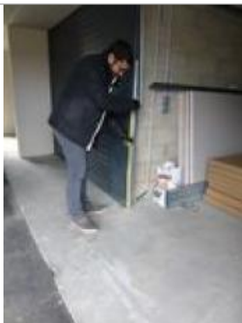
Vue de la laisse - SPC SMYL