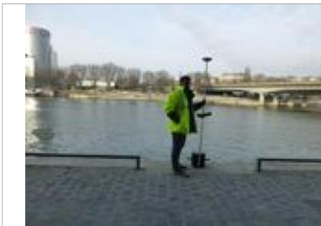
Vue de la laisse - SPC SMYL

Altitude calculée de l'eau (en m) : 29.691 m