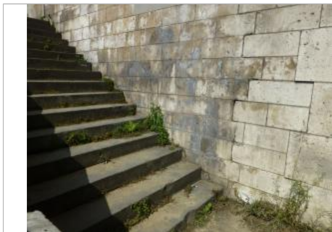
Vue de la laisse - SPC SMYL

Altitude calculée de l'eau (en m) : 30.438 m