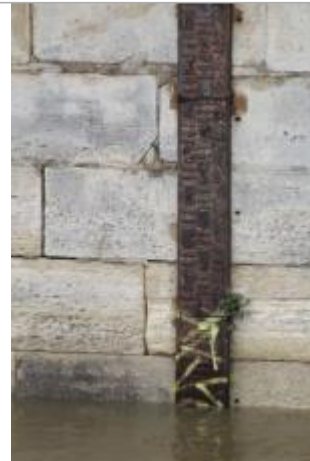
Vue du site - SPC SMYL