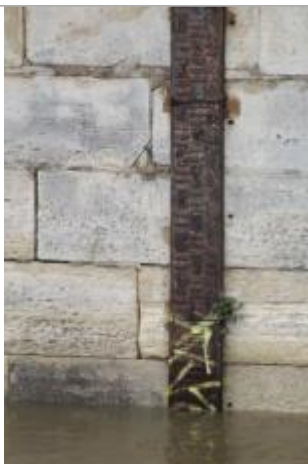
Vue de la laisse - SPC SMYL