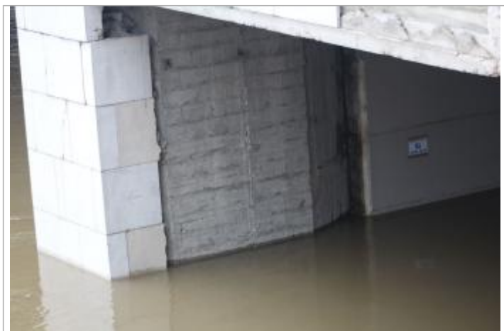
Vue de la laisse - SPC SMYL

Altitude calculée de l'eau (en m) : 30.222 m