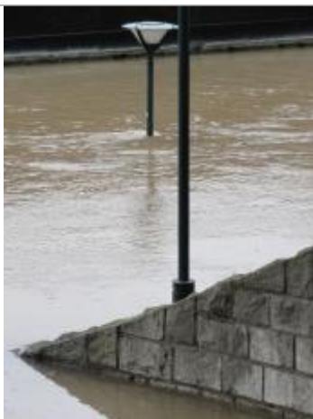
Vue de la laisse - SPC SMYL