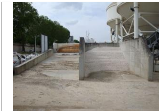
Vue de la laisse - SPC SMYL

Altitude calculée de l'eau (en m) : 31.727 m