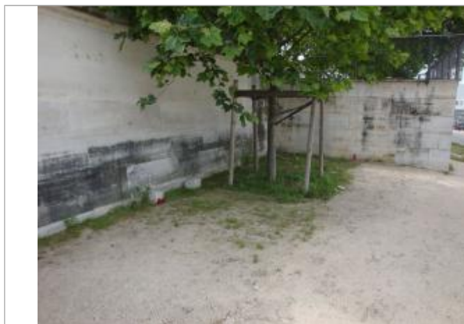
Vue de la laisse - SPC SMYL

Altitude calculée de l'eau (en m) : 31.693 m